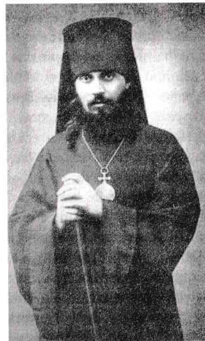
Episcopul Arsenie Jadanovski (6 martie 1874 – 27 septembrie 1937)

D umnezeu a rânduit să aleg viața monahală în urma rugăciunilor și binecuvântării Părintelui Ioan de Kronstadt. După ce am fost admis la Școala Teologică, am început să caut prilejuri de a-l întâlni pe Părintele la Moscova, unde adeseori venea pentru a sluji Sfânta Liturghie și a-i cerceta pe bolnavi. Dumnezeu mi-a îndeplinit dorința curând. Colegul meu, Ilie Abburruss, mai târziu arhimandritul Ignatie,